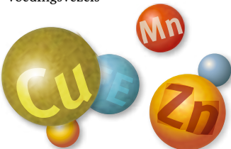
Sporenelementen met belangrijke stofwisselingsfuncties