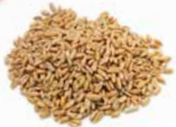
Origineel Kanne® gefermenteerd graan met natuurlijk melkzuur