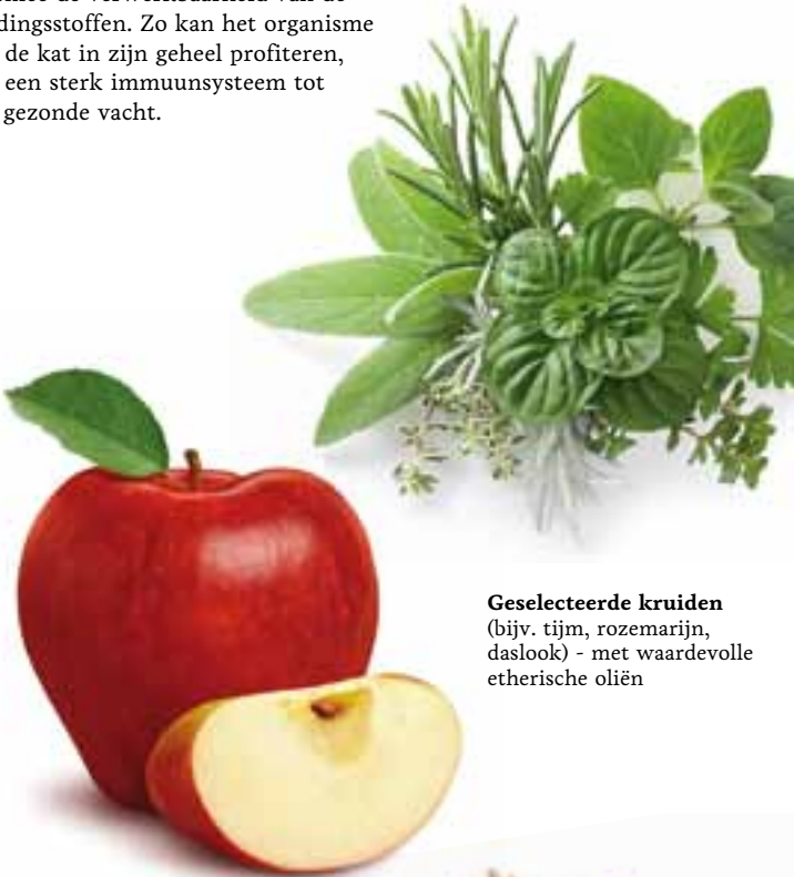
Geselecteerde kruiden (bijv. tijm, rozemarijn, daslook) - met waardevolle etherische oliën

Het Happy Cat LifePlus Concept® is een unieke mix van natuurlijke ingrediënten die echt goed zijn voor uw kat. Uiterst werkzame componenten zorgen voor een actieve stofwisseling en bevorderen daarmee de verwerkbaarheid van de voedingsstoffen. Zo kan het organisme van de kat in zijn geheel profiteren, van een sterk immuunsysteem tot een gezonde vacht.